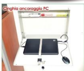
Portata max piano Kg 15 Scope of the plan kg.15